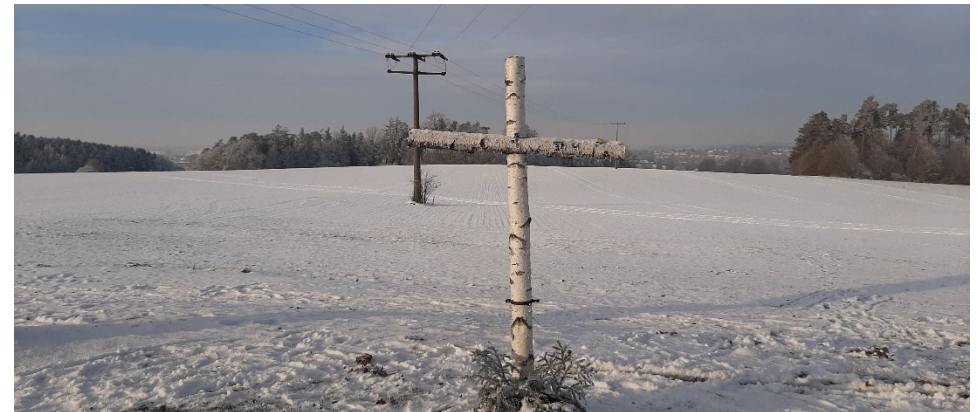
Das Kreuz aus Birkenholz neben der Ulrichskapelle.

Bitte Gott um seinen Segen: Gott, segne mich und behüte mich. Lass leuchten dein Angesicht über mich und sei mir gnädig. Erhebe dein Angesicht auf mich und gib mir deinen Frieden. Amen. Verabschiede dich von dem heutigen Pilgerweg mit dem Auferstehungsgruß: „Der Herr ist auferstanden. Er ist wahrhaftig auferstanden!“ Geh jetzt gesegnet heim. Und geh gesegnet in die Zeit nach Ostern.